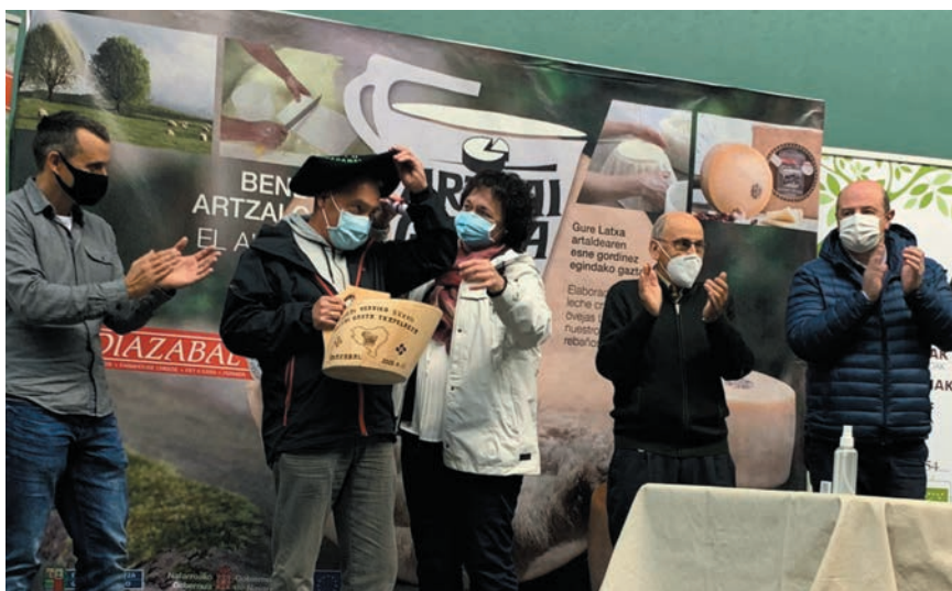
LOS GANADORES DEL CONCURSO RECIBIENDO EL PREMIO.