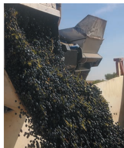
LOS COSTES SON MUY COMPLEJOS.