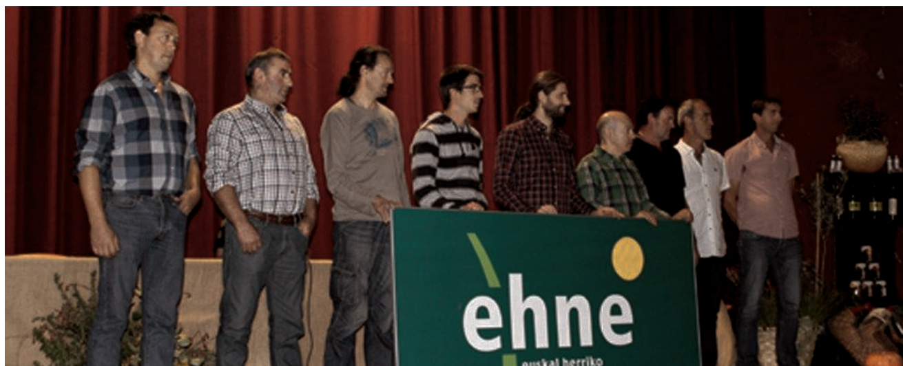
IMAGEN DEL ÚLTIMO CONGRESO LLEVADO A CABO POR NUESTRO SINDICATO.