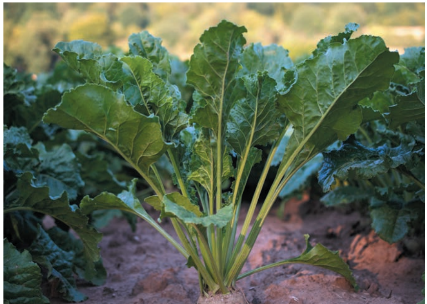
EL 3 DE NOVIEMBRE SE PREVÉ LA APERTURA DE LA FABRICA.

Por otra parte el Gobierno Vasco ha ratificado la prórroga de las ayudas agroambientales por 2 años (1+1), con las mismas condiciones en los compromisos y en la cuantía econó-