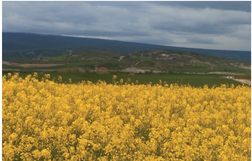
SE VA A REFORZAR LA CONDICIONALIDAD.

La principal novedad aprobada este mes es que al menos el 20% de las ayudas directas se va a destinar a los ecoesquemas, es decir, ayudas de carácter voluntario para las explotaciones que adopten medidas adicionales en