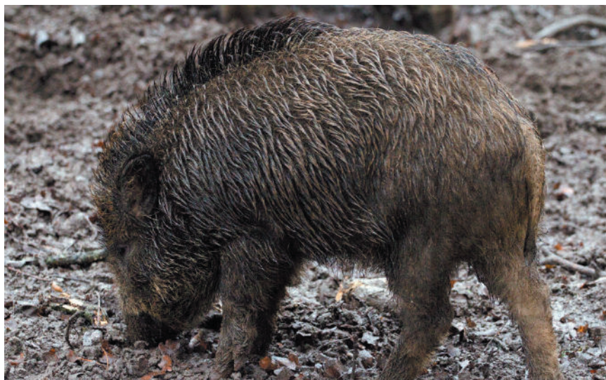
LOS CASOS DE PPA AVANZAN EN VARIOS PAÍSES EUROPEOS.

Es importante solicitar la documentación de bienestar animal a todos los camiones que entren con lechones pidiendo el origen, destino y con-