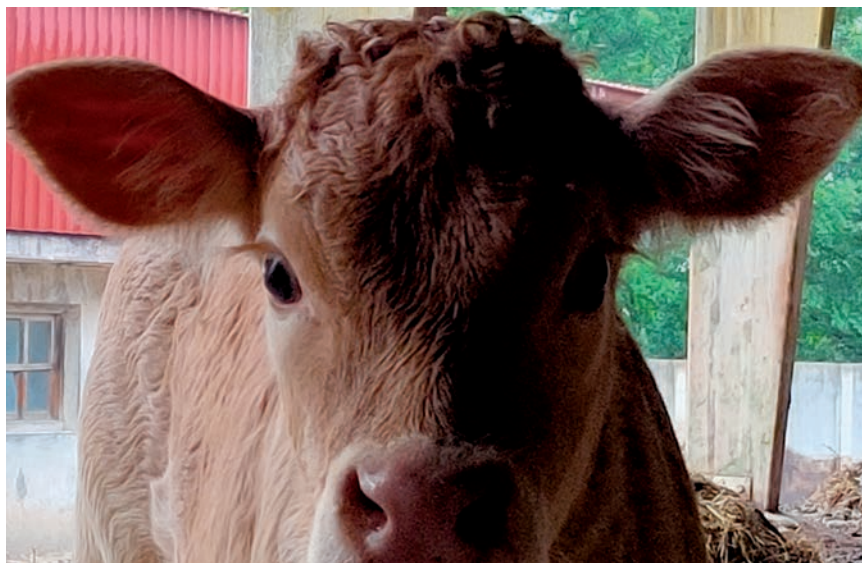
EN EL 2019 HA DESCENDIDO EL PRECIO DEL PASTERO.

Lurgintza kooperatibaren baitan barazkigileak urtetik urtera gehitzen