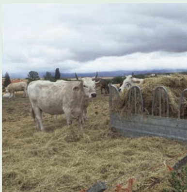
LA PREFERENCIA COMUNITARIA, VITAL.

La PAC para el periodo 2023-2027 estará dotada de unos 390.000 millones de euros del presupuesto europeo, de los que 47.724 millones irán a parar a los agricultores y ganaderos en España, una suma similar a la del periodo 2014-2020, según cifras del Ministerio de Agricultura.