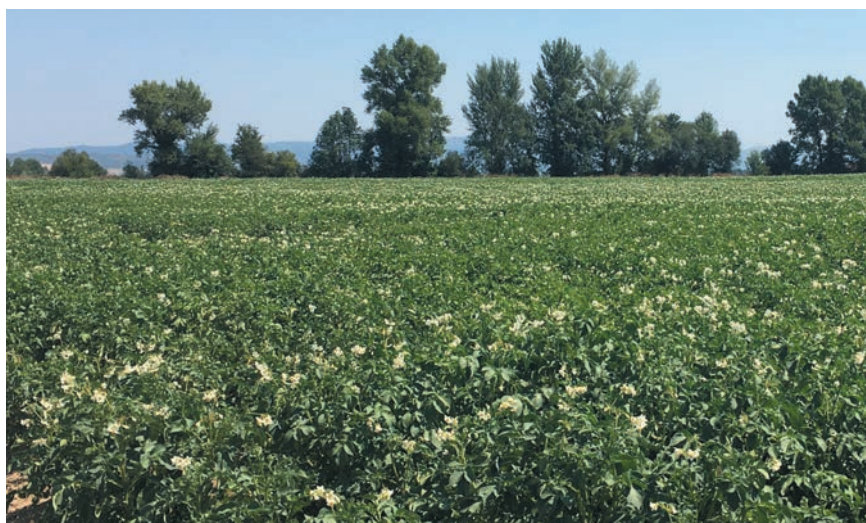
LA AYUDA ES DE 150€ POR HECTÁREA.