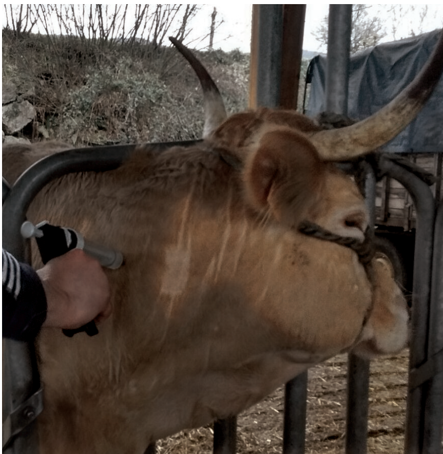
TODA LA CABAÑA DE RUMIANTES DEL NORTE DE NAFARROA SERÁ VACUNADA.

La respuesta del departamento fue que en la última campaña de vacunación contra la lengua azul, la tasa de abortos no varió, según sus datos, con la que se produce durante cualquier otro año, mostrándose firmes en su idea de llevar a cabo tal medida