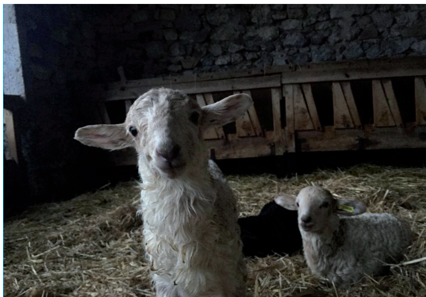
EN EL 2019 HA ASCENDIDO EL PRECIO DEL CORDERO.