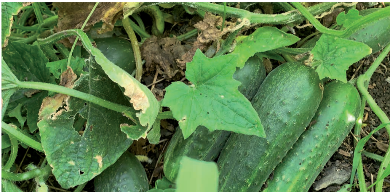
LOS Y LAS HORTICULTORAS QUE REALIZAN VENTA DIRECTA DEFENDEN MEJOR EL PRECIO DE SU PRODUCTO.