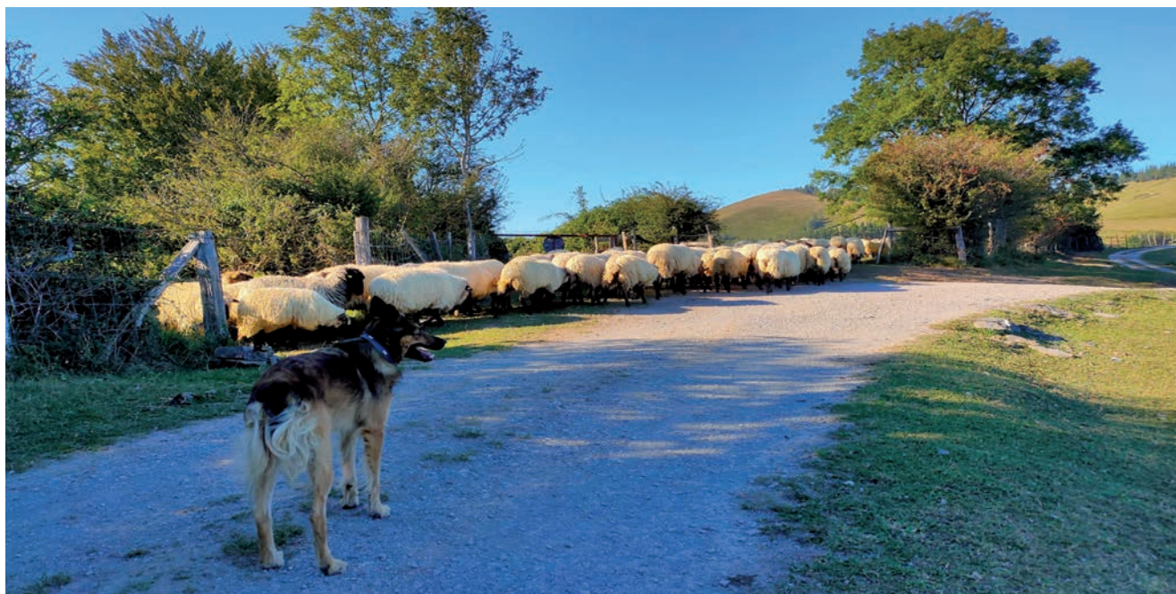
LA MEDIA DE CABEZAS DE GANADO EN LAS EXPLOTACIONES LECHERAS HA SUBIDO.