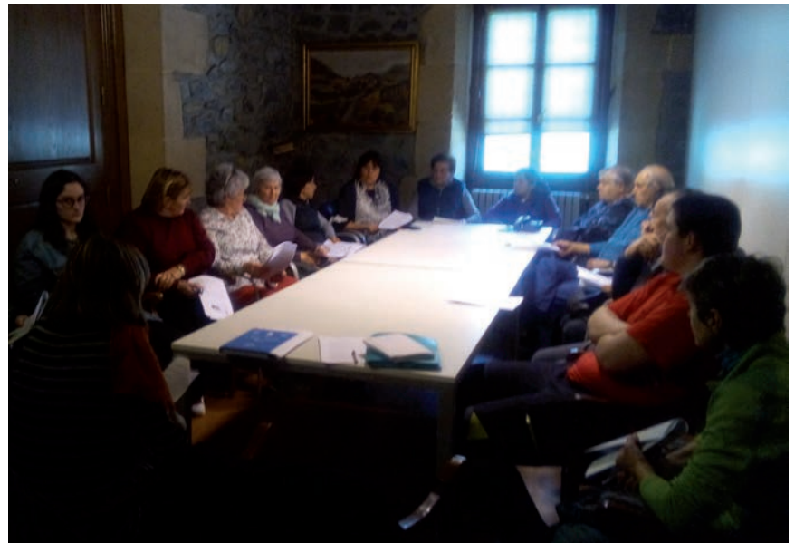
HURRENGO HITZALDIEN DATA DATOZEN HILABETETAN JAKINARAZIKO DU EBELEK

Urriaren 8an hasi eta urriaren 29an bukatu zituzten hitzaldian: Oiartzungo bibliotekan, Zaldiabiko