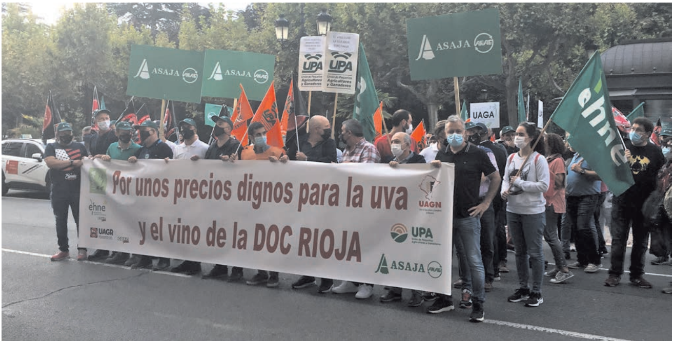
LA MANIFESTACIÓN FINALIZÓ FRENTE A LA DELEGACIÓN DEL GOBIERNO EN LOGROÑO.