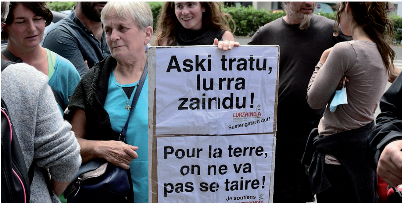
IRUDIAN, BERRUETA BIDEKO ARBONAKO LURRAK LABORANTZARAKO IZAN DAITEZEN PROTESTA EGITEN.