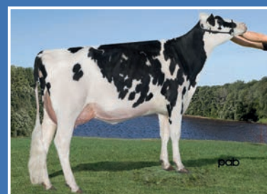
GEN-1-BEQ SNOWMAN AKILIA ET (EX-91) Madre de KIWI