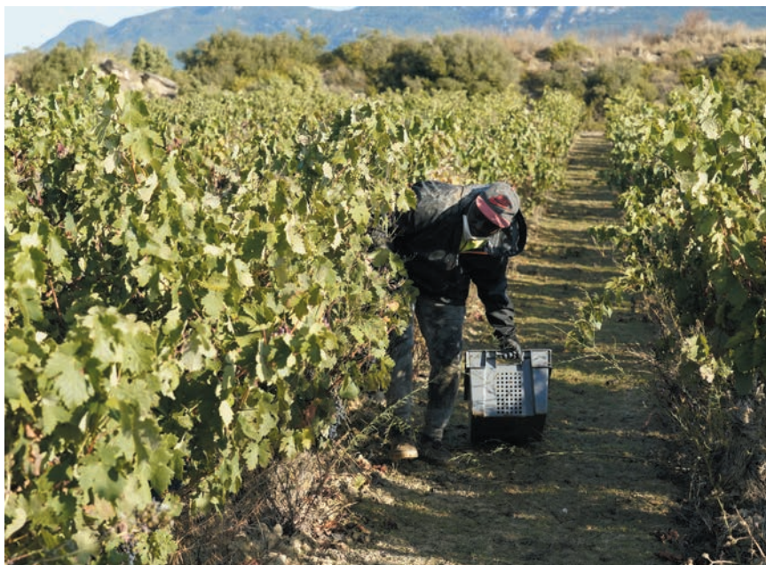
TEMPORERO EN LA VENDIMIA DE 2020.

se ofrecerá la vacunación con una dosis de la vacuna Janssen a toda aquella persona temporera no vacunada que así lo solicite. Las pruebas PCR y la vacunación se realizarán en el Frontón de Laguardia hasta el 15 de octubre.