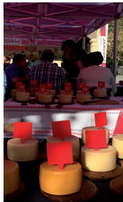
IRUDIAN, GAZTA LEHIAKETA

Bestetik, gogoratu behar da, urriaren 31n izango dela Zaldibian Ardiki eguna eta bertan XXVI. Mondeju lehiaketa izateaz gain, Aralarko Artzain Gaztaren XXIII. lehiaketa ere egingo dute. Jai egun hau ere Covid-19aren kontrolerako protokoloak betez ospatuko da.