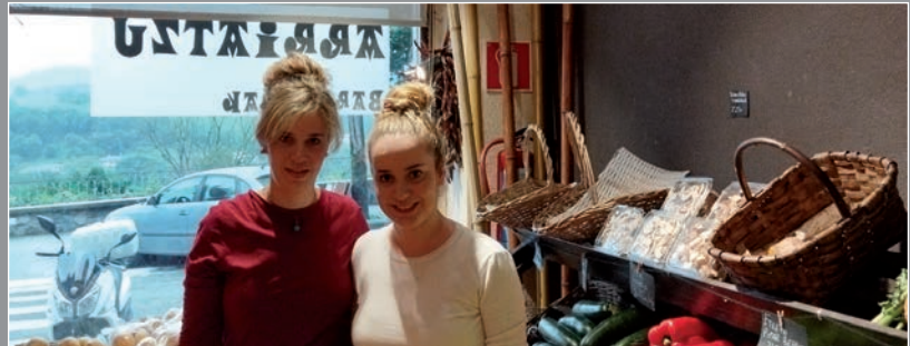
IRUDIAN, ZEBERIO AHIZPAK

Guri onura ekarriko digu, orain arte ez garelako proiektua gauzatuko den eremuraino iritsi. Ezagutzera emateko oso baliagarria izango da. Balio erantsia du gainera, ez goaze-