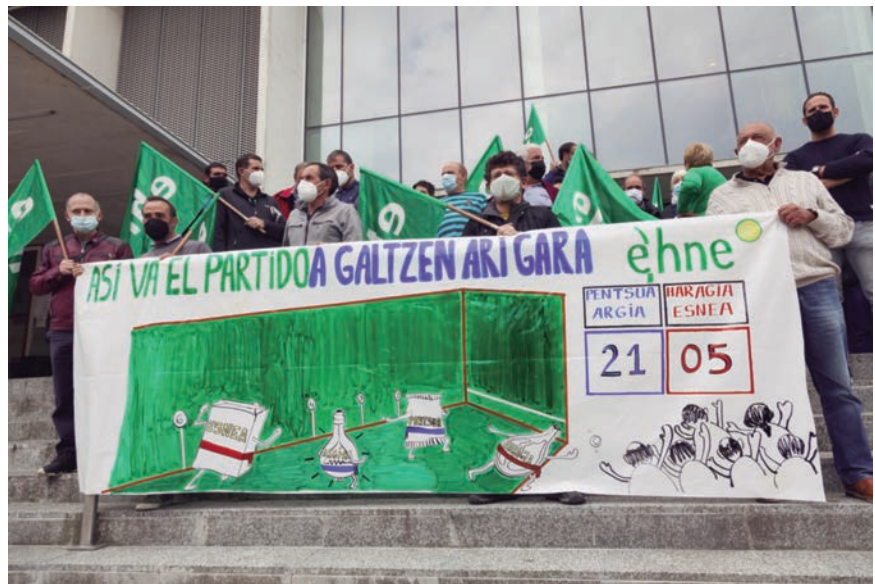
MOMENTO DE LA CONCENTRACIÓN FRENTE A DESARROLLO RURAL

Para poner freno a esta dinámica, exigieron que se aplique de manera contundente la Ley de la Cadena Alimentaria, “un instrumento que no