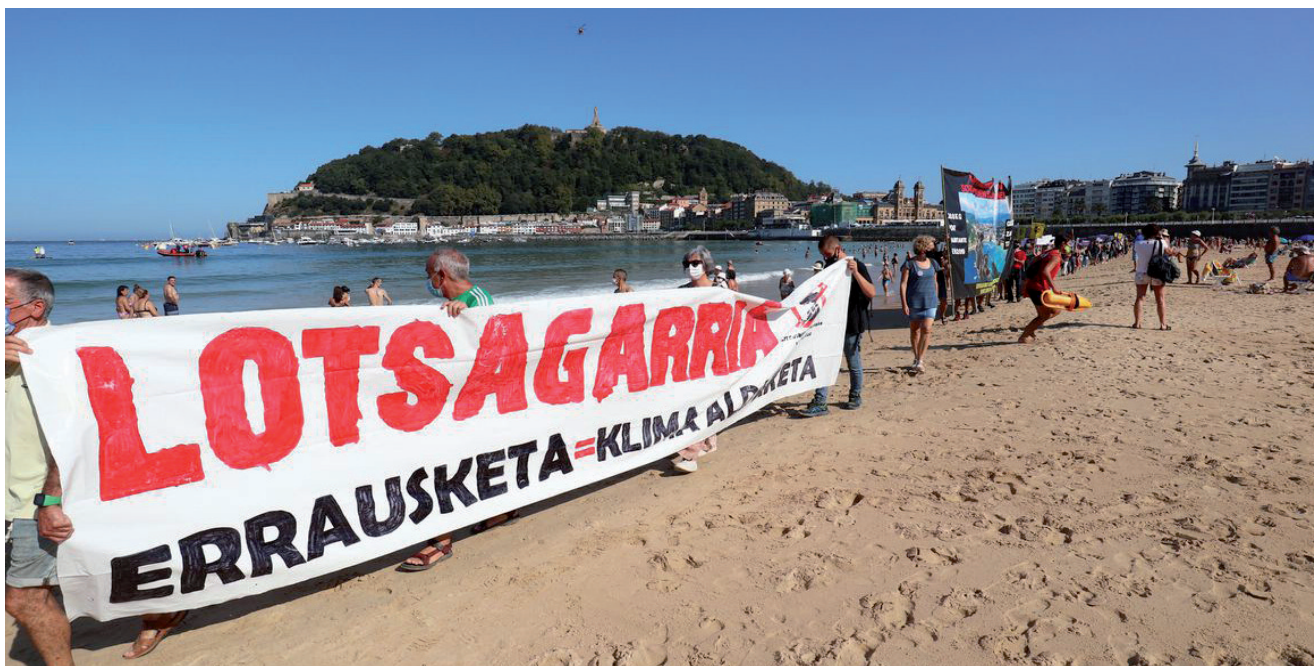
DONOSTIAN KONTXAKO HONDARTZAN ERRAUSTEGAIEN KONTRA EGINDAKO MANIFESTAZIOAREN IRUDIA