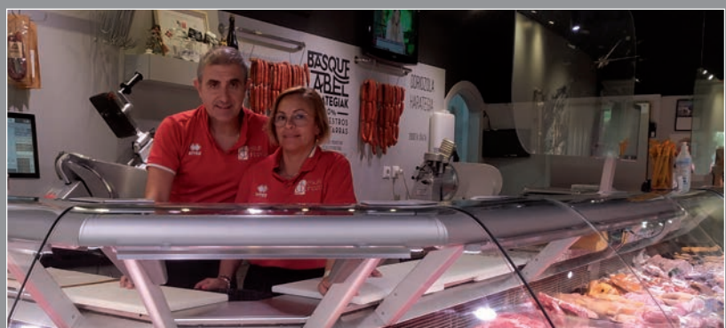
JESUS ODRIOZOLA OÑATIN DUEN HARATEGIAN

lagoa egiteko aukera emango digu. Komertzialak egunero etortzen dira edonongo produktuekin baina beraiek beren marjina ezartzen diete produktu horiei, eta horrek estutzen gaituzte denok. Baina proiektu honekin zentzuzko merkataritza bideratu nahi dugu, kate guztiko eragile guztiek bizitzeko moduko marjinak ateratzea denen artean