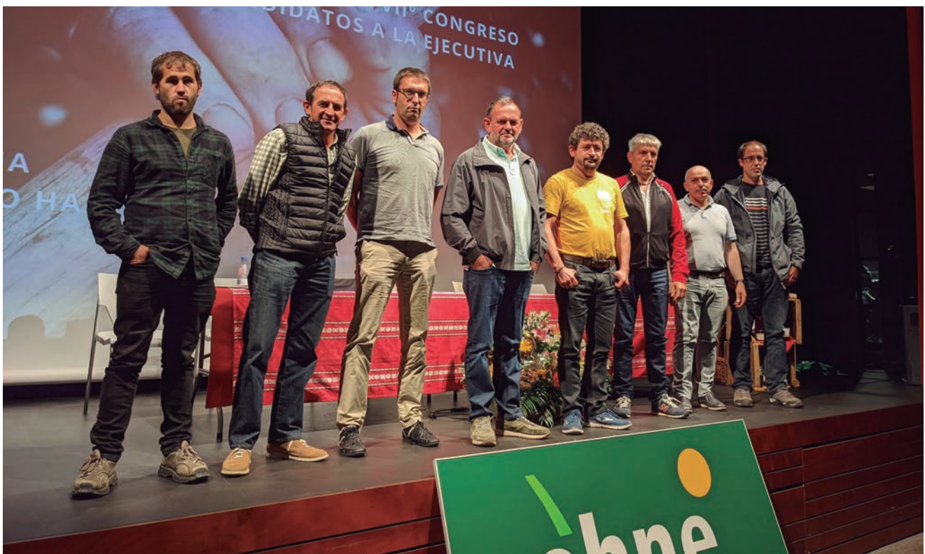
LA NUEVA EJECUTIVA ESTÁ COMPUESTA POR OCHO MIEMBROS DE DIFERENTES ZONAS DE NAFARROA