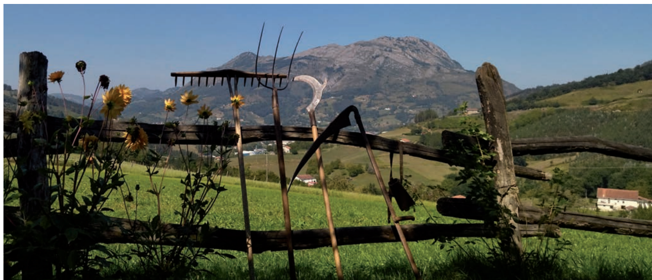
‘BERRIKUNTZEKIN BATERA, OINARRIZKOAK’

El primer premio ha sido para Ainhoa Altuna con la imagen ‘Emakumea zutarri’. Ioritz Aizpuru ha conseguido el segundo premio con la foto de ‘Berrikuntzekin batera, oinarritzkoak’. Y por último, Carlos Herrán se ha hecho con el tercer puesto con ‘Contribuyendo a la sostenibilidad de la humanidad’. ¡Disfruten los premios!