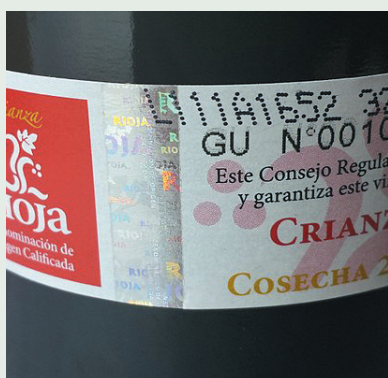
ETIQUETA DE RIOJA.

Ministerio de Empleo, los ciudadanos pueden notificar las conductas fraudulentas en el ámbito laboral para que sean objeto de análisis y, en su caso, de investigación por la Inspección de Trabajo de la Seguridad Social. En este buzón también pueden presentar denuncias los trabajadores que sean víctimas de prácticas de fraude laboral y a la Seguridad Social.