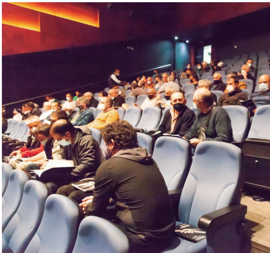
ALGO MÁS DE UN CENTENAR DE AFILIADAS Y AFILIADOS PARTICIPARON EN EL CONGRESO