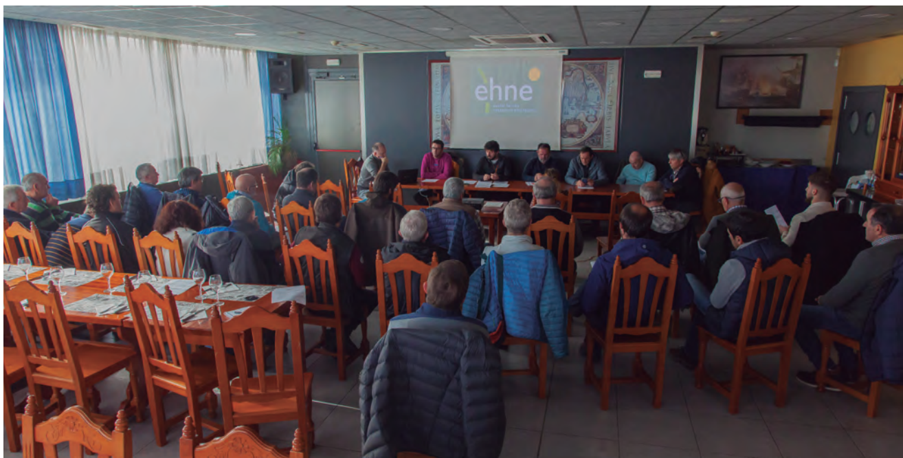
IMAGEN DE LA ASAMBLEA ANUAL QUE EHNE-NAFARROA CELEBRÓ EL PASADO 15 DE DICIEMBRE