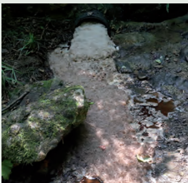
ARKAITZERREKA. IRUDIA, AIURRI

horiek oinarri hartuta, eta ikusita Zubietakoak 2,00 pg-EQT-ko kopurua azaleratu duela, Mugimenduko kideek gaineratu dute “horrelako emaitzak izatea oso kezagarria dela”.