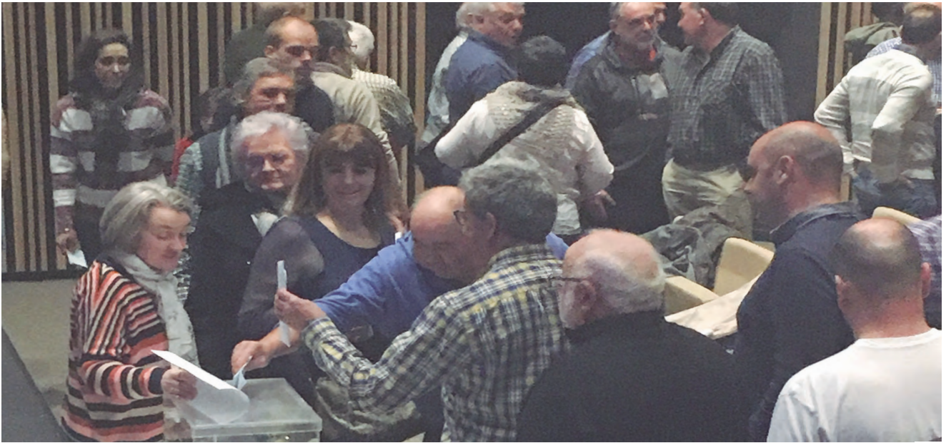
IMAGEN DE LAS ELECCIONES DE 2019.