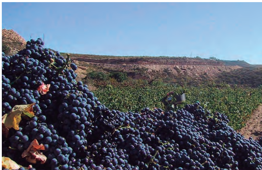
EL 88% DEL TOTAL ES UVA TINTA