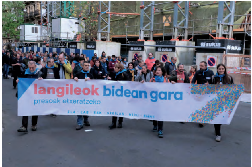
ABENDUAREN 20KO MOBILIZAZIOA, URTARRILAREN 7RAKO DEIALDIA EGINEZ