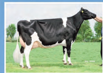
DE BIESHEUVEL JAVINA 19 ET (VG-88)

Dolomita Delta Jaidyn et Drost x Esperanto x Reflector