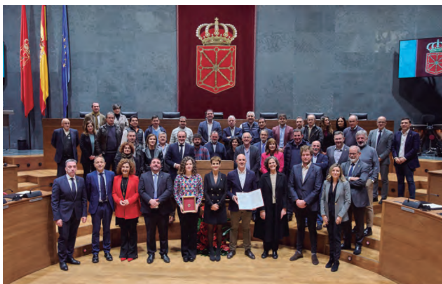
FOTO DE GRUPO DEL DÍA DE LA CELEBRACIÓN