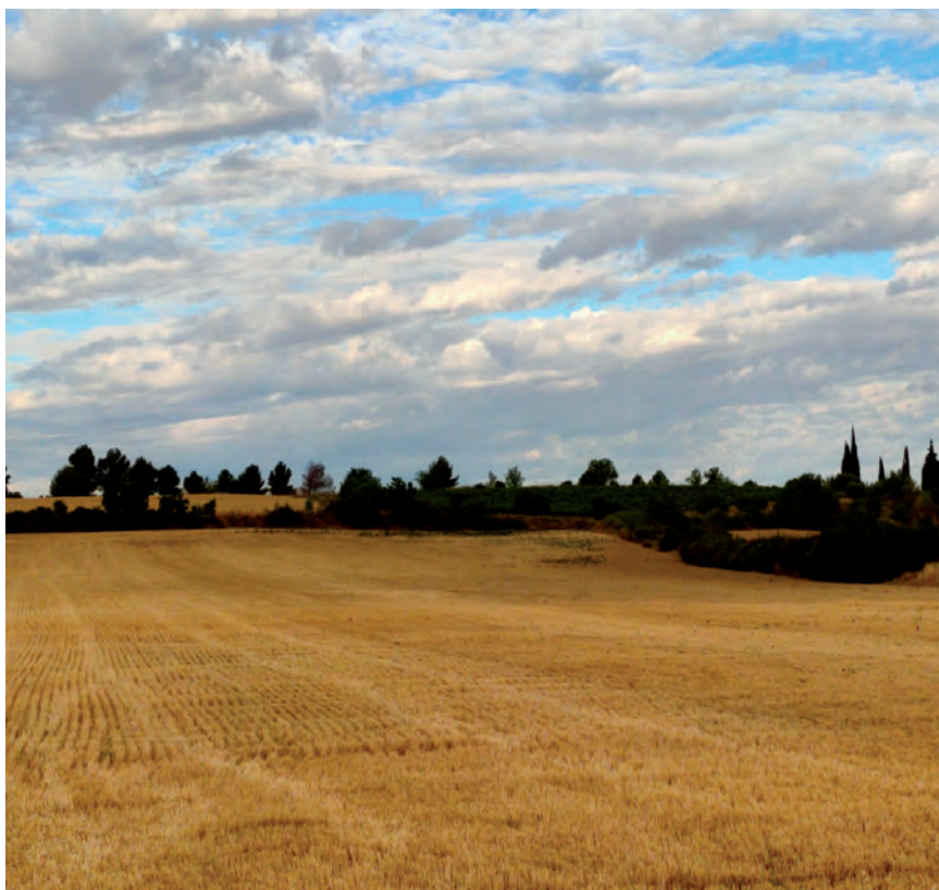
EHNE PLANTEÓ LA COMPRA PÚBLICA DE DE FORRAJES, PERO TODAVÍA NO HA DADO FRUTOS

Por el contrario, el trabajo de EHNE durante años, en promover conciencia por la soberanía alimentaria está dando sus frutos, concienciar a la sociedad de consumir local, consumir calidad y que esto tiene un coste, ha sido y será una de las tareas principales a futuro también. Tenemos herramientas que la sociedad identi-