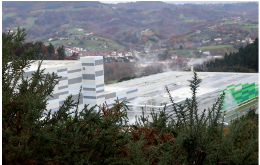
IRUDIAN, ZUBIETAKO ERRAUSTE PLANTA. IRUDIA, AIURRI ALDIZKARIA

Hala ere, beste substantzia batzuk ere topatu dituzte: PFAS. “Biomatriseetan, goroldioetan, arrautzetan eta sedimentuetan” agertu omen dira. Antza denez, lege-