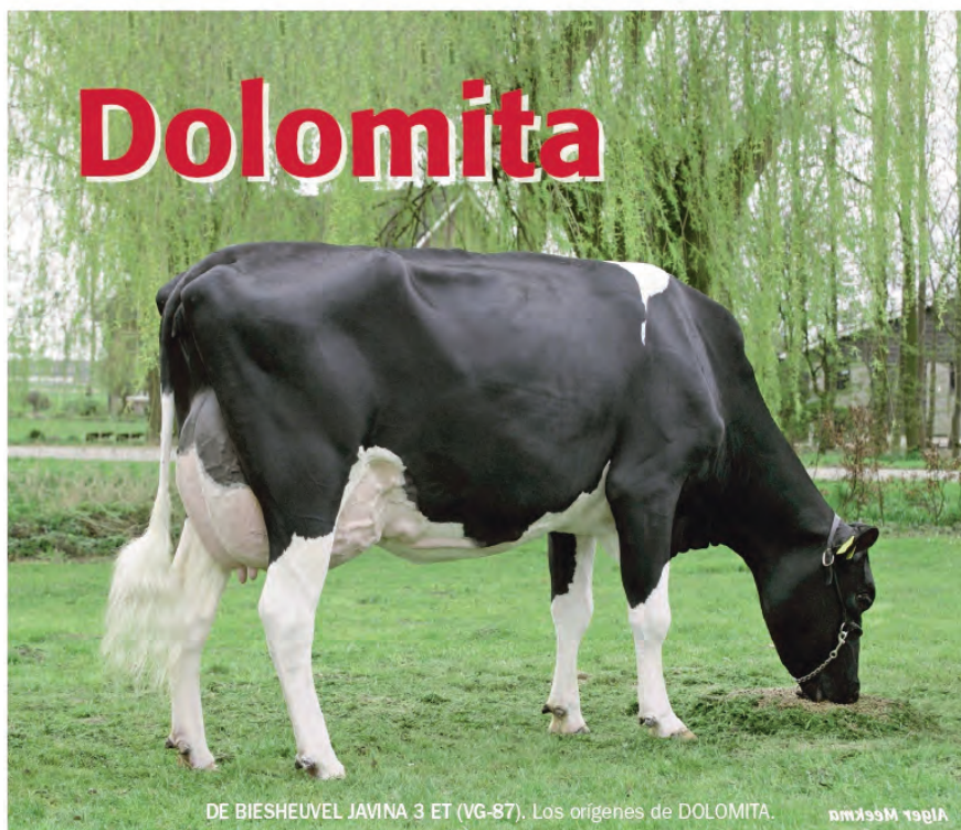
DE BIESHEUVEL JAVINA 3 ET (VG-87). Los orígenes de DOLOMITA.

En próximos días se realizará una asamblea del colectivo de remolacha para acordar los pasos a seguir.