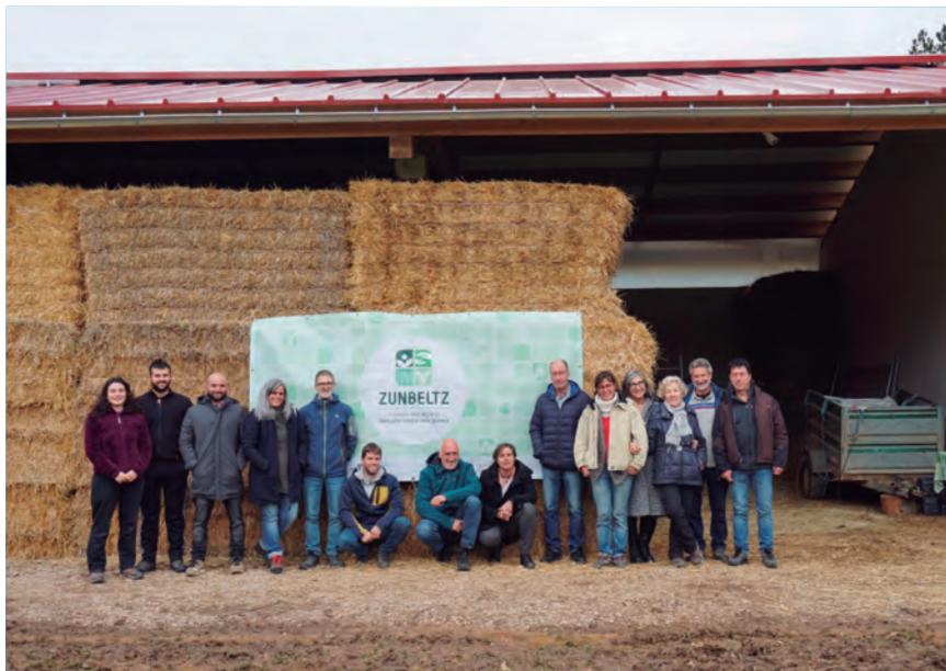
IMPULSORES DE LOS PROYECTOS GANADEROS Y DEL ESPACIO ZUNBELTZ

Zunbeltz les ofrece soporte físico (tierras e infraestructuras), formación práctica y asesoramiento por personas ganaderas expertas, además de acompañamiento en todo lo que supone el proceso legal. En concreto, 12 ganaderos expertos están acompañando de manera individualizada a los citados téster, además de haberse organizado un calendario formativo con la UPNA y CPAEN/NNPEK, en torno a comercialización, transformación, manejo y producción, entre otras cuestiones. Junto a ello, se han llevado a cabo sendos estudios sobre los hábitos de consumo de la ciudadanía navarra y