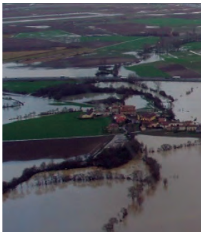
INUNDACIONES DEL ZADORRA.

Los debates abarcaron aspectos como la gestión de las inundacio-