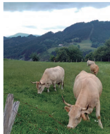
TERNERA DE NAVARRA