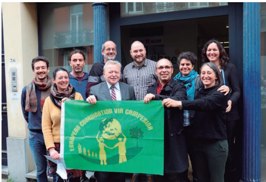
JANUSZ WOJCIECHOWSKI EN LA INAUGURACIÓN DE LA OFICINA DE ECVC.