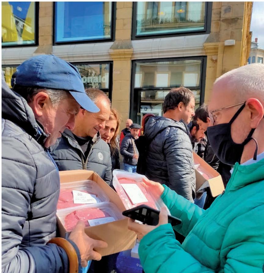
PROTESTA GISA HARAGIA BANATU ZUTEN JENDEAREN ARTEAN

Espainiar estatu guztian txahal haragiaren prezioa izaten ari den gorakada izugarria haragi faltak eta ekoizpen kostuen gorakadak bultzatua da. Lotsagarria da, izan ere, euskal abeltzainoi estatuan baino merkeago