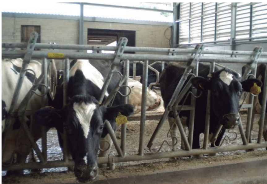
LAS AYUDAS AL VACUNO DE LECHE OSCILAN ENTRE LOS 80 Y LOS 210 EUROS POR ANIMAL.