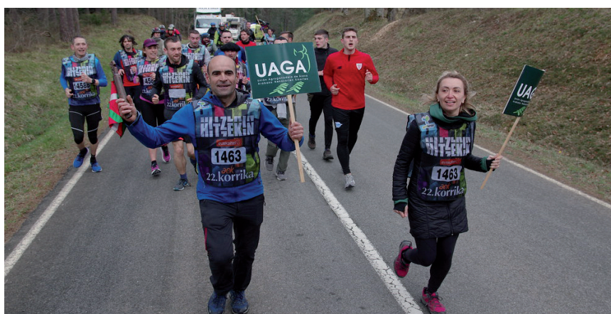
ZARATEK MANURGARA KO BIDEAN UAGA KO KIDEAK LEKUKOA ESKUAN