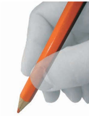
Iritzi artikuluak Cartas de opinión