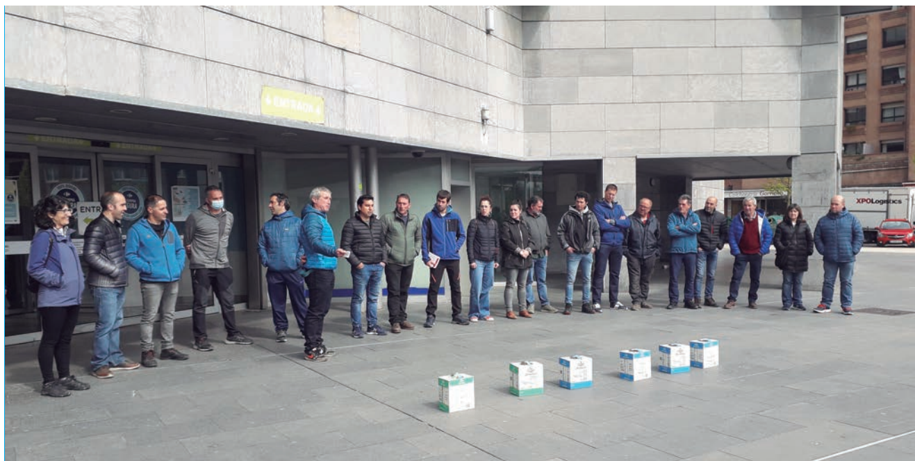
LAS GANADERAS Y GANADEROS EXPUSIERON ANTE LOS CONSUMIDORES LAS MARCAS BLANCAS POR DEBAJO DEL COSTE DE PRODUCCIÓN.

Los productores de Nafarroa vuelven a movilizarse por el precio de la leche