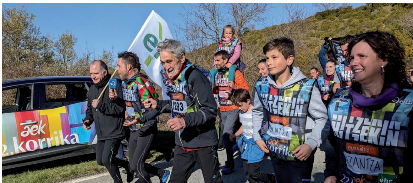
NAFARROAKO EHNEKO KIDE HISTORIKOAK, EGUNGOAK ETA BELAUNALDI BERRIAK BAT EGINDA AZANTZAN EGIN ZUTEN KORRI