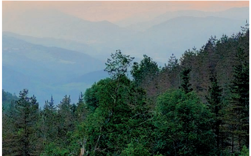
GAITZ KRIPTOGAMIKOEN KONTRAKO TRATAMENTUA EGIN DAITEKE

Aipatu tratamendua ezin du edonor eta edonon egin. Tratamenduak egin nahi dituzten pertsonak aurretik jakinarazi beharko diote Gipuzkoako Foru Aldundiko Ekonomia Sustapeneko, Turismoko eta Landa Ingurune Departamentuari. Hala ere, aipatu departamentuak aldeztu aurretik hainbat lur eremu zehatuta ditu, non oxido kuprosoa lurrian aplikatzea baimentzen duen. Lursail horien zerrenda eta deskribapen kartografikoa webgune honetan argitaratu du: https://www.gipuzkoa.eus/eu/web/mendiak-eremunaturalak/mendikudeaketa/baso-kudeaketa/baso-osasuna .