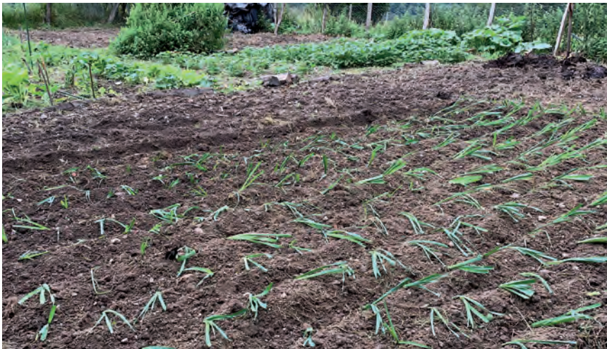
LA SUPERFICIE DEDICADA AL CULTIVO ECOLÓGICO HA AUMENTADO UN 16%