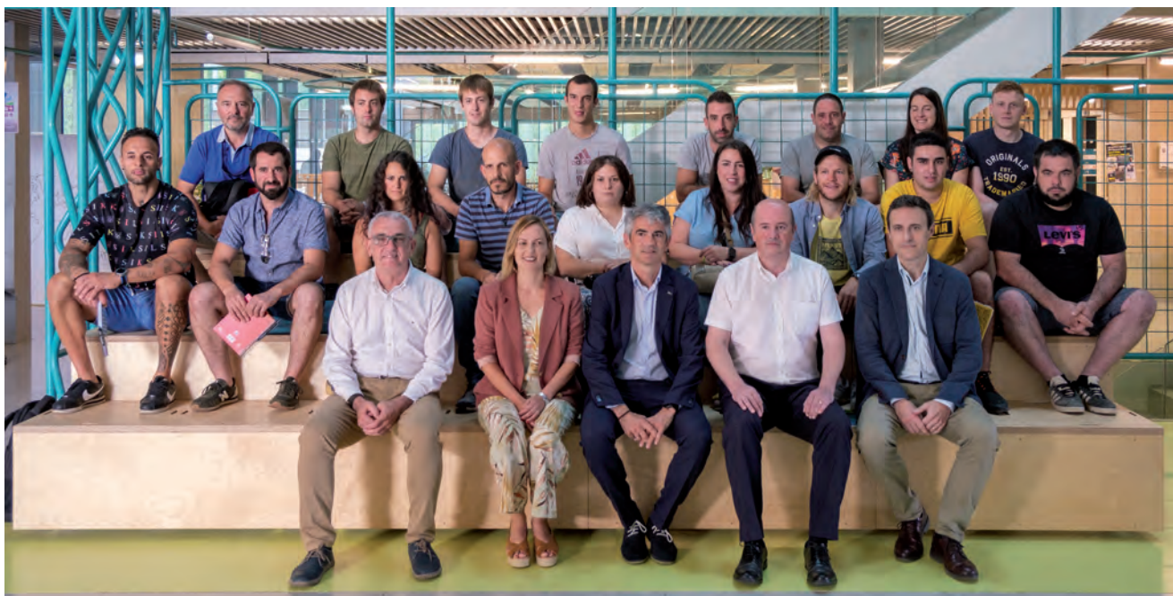
OÑATIN EGIN ZUTEN GAZTENEK BERRI PROIEKTUAREN AURKEZPENA