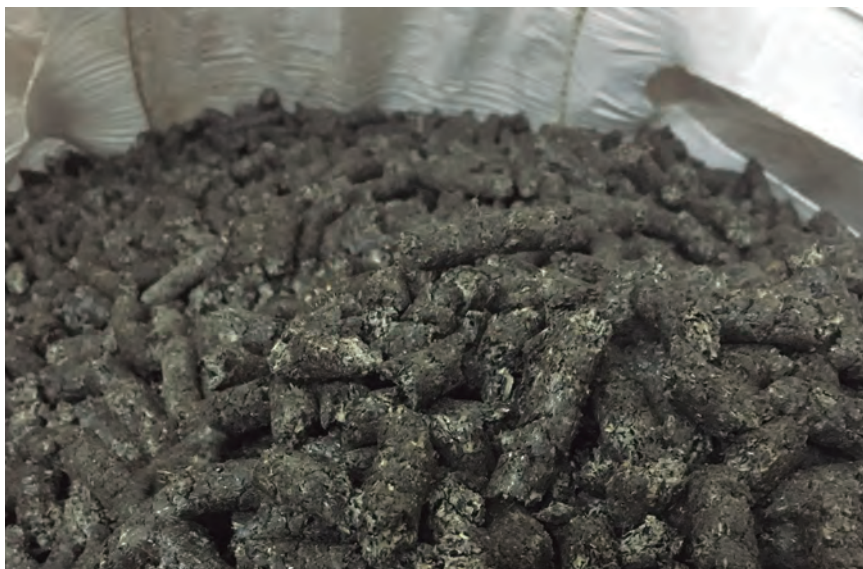
TORTA QUE SE APROVECHA PARA ALIMENTACIÓN ANIMAL TRAS LA EXTRACCIÓN DE ACEITE.