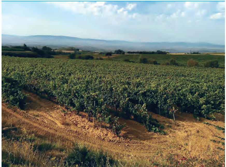
EL VIÑEDO MANTIENE UN ESTADO VEGETATIVO CORRECTO.

UAGA votó en contra de la propuesta ya que, si bien podía aceptar un rendimiento del 95%, no estaba de acuerdo de que se destinaran los porcentajes admitidos para destilación y vino de mesa.