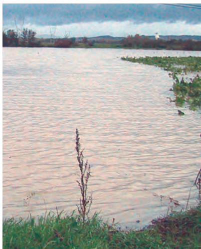
ZONA INUNDABLE DEL ZAYA

La sentencia, ante la que aún cabe recurso, anula el proyecto al no haber cumplido el requisito imprescindible de recibir el visto bueno previo de la Confederación Hidrográfica del Ebro.