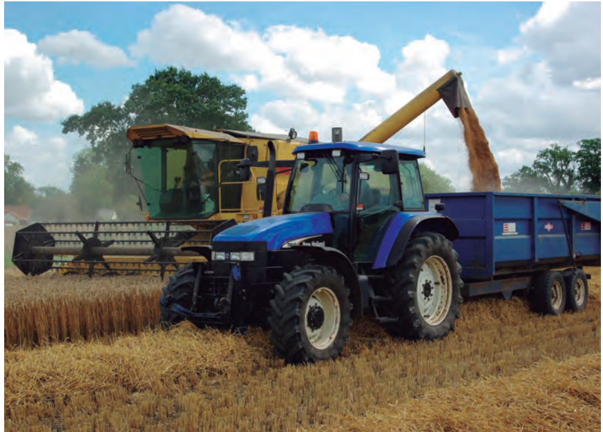
LA COSECHA DE LA PRESENTE CAMPAÑA ESTÁ SIENDO ESPECIALMENTE COMPLICADA

La presión de EHNE-Nafarroa y otras centrales sindicales del sector primario, junto a un informe del Servicio de Agricultura que instaba a dejar sin efecto la prohibición de dichas labores agrícolas en meteoalerta naranja por el grave perjuicio que ello podía ocasionar al suministro alimentario, han traído consigo un cierto relajó en la Resolución emitida por la Dirección de