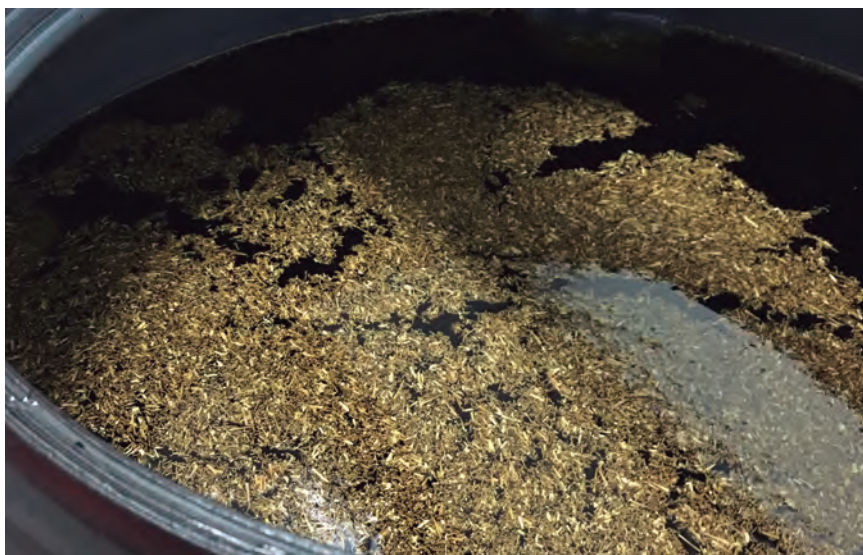
ACEITE DE COLZA PREVIO A SU DECANTACIÓN Y FILTRADO FINAL.

entorno... y también queremos salir de los Pirineos hacia el norte.