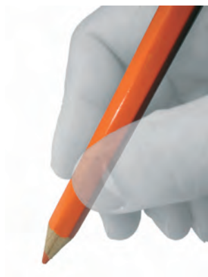
Egilea/ Autor: Jon Jausoro

E Como vecino de un pequeño pueblo alavés, al igual que la mayoría de la población de Euskal Herria, estoy preocupado por el complicado futuro que se nos presenta en adelante.