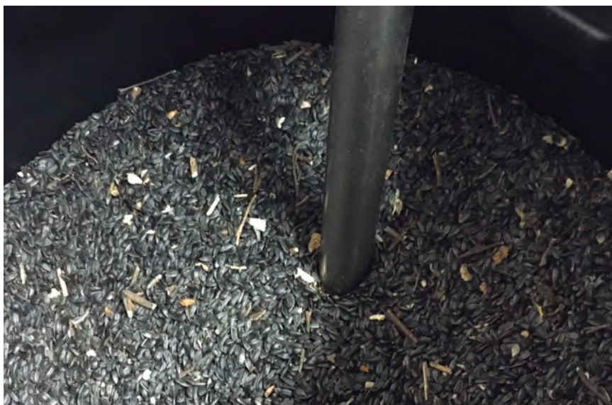
PIPAS EN EL PROCESO DE ASPIRACIÓN PARA SU PASO A LA PRENSA