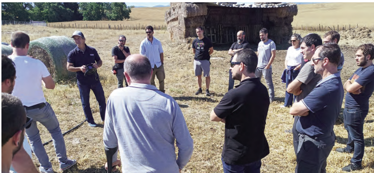
GANADEROS ALAVESSES EN LA JORNADA DE GANADERÍA Y AGRICULTURA REGENERATIVA ORGANIZADA POR UAGA.

dentro de tres meses... esa vaca tiene un requerimiento mucho mayor que la que está gestando, casi de 3 a 1. Ahora, cuando vamos a dar el pienso, ya deja de ser una suplementación estratégica, porque termina pasando que le damos el pienso tanto a la que está gestando, que no necesita comida, como a la que está amamantando que necesita mucha comida. Entonces, la suplementación se hace terriblemente ineficiente.