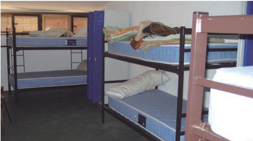
LAS AYUDAS SON PARA CREACION, ADAPTACIÓN O EQUIPAMIENTO DE ALOJAMIENTOS