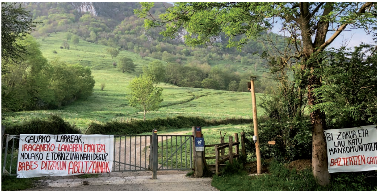
ARALARKO LARRETARA IGOTZEKO LARRAIZKO LANGAN PROTESTA PANKARTAK JARRI ZITUZTEN