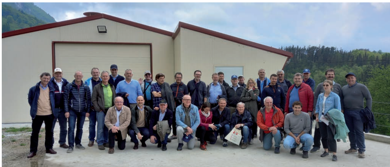
Mendiko baserriko Lumagorri oilasko ekoizpena nolakoa den ezagutu zuten