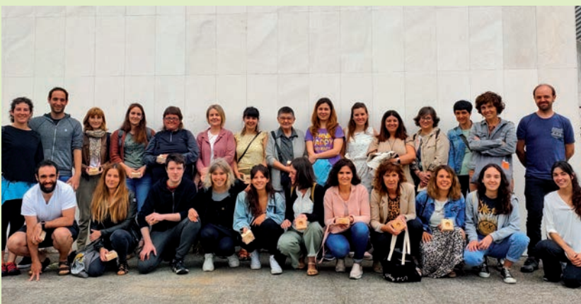
LUFE ALTZARIAK ENPRESA IKUSTERA, IRTEERA. San Isidro egunez EHNEk EHNElURek eta Lurgintzak elkarrekin egin ohi duten irteeran Lufe Altzariak enpresa ikustera joan dira aurtien. Bertako intsignis pinuarekin egiten dituzte altzariak. Euskal IKEA bezala baiatu dute hainbat hedabidetan.