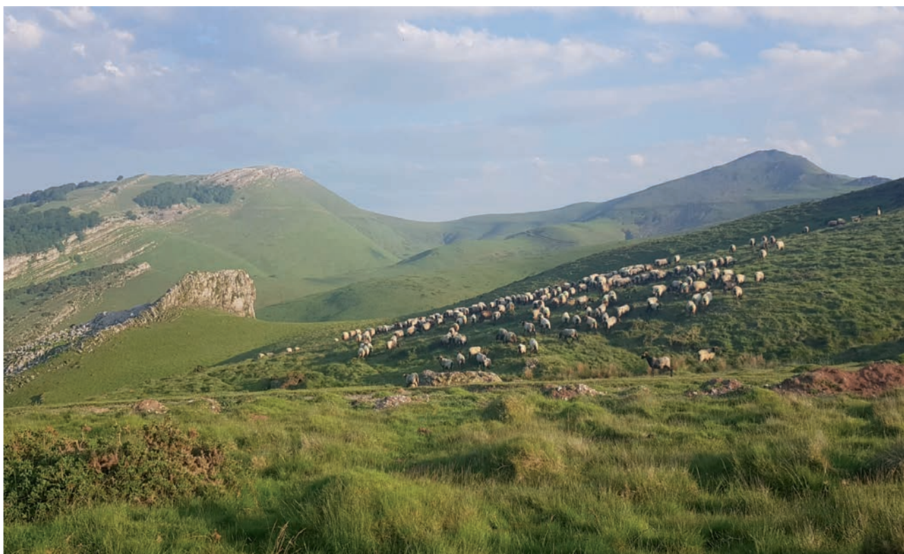
GALÁNEK ZAINDU BEHAR ZUEN ARTALDEA HAREN LARRE EREMUAN.

de una explotación. Es decir, lo que yo estudiaba era esta dualidad de científica-pastora. Pero tengo que decir que de una sola experiencia no se puede sacar una conclusión. Yo lo que he intentado explicar es cómo se vive ahí, en la montaña, no he estudiado la sostenibilidad del manejo de los pastos de montaña. Yo lo que he intentado explicar es la teoría y la práctica del pastoreo en montaña y las implicaciones personales que tiene en la vida de una profesional, para que la gente entienda que hay mucha ciencia y mucho arte detrás del pastoreo.