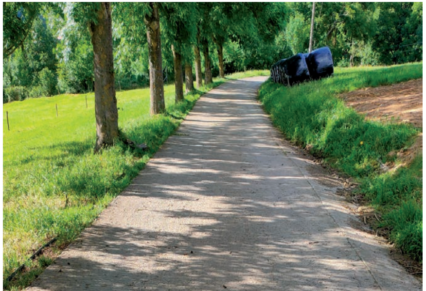
BIDE GEHIENAK PARTIKULARRAK DIRELA NABARMENDU DU EHNEK

Bigarren berrikuspenean, aurretik EHNEtik egindako zenbait ekarpen aintzat hartu dira: esaterako, lan jakinak egiteko zehazten ziren urte sasoiei egindako erreferentzia kentzeko egindako proposamena kendu dute ordenantzatik. Bestetik, baso pistei buruzko aipamena ordenantzatik kanpo uzteko eskaera egin da, izan ere, gehienak lur bideak izateaz gain, partikularrak baitira. Era berean, eguraldi txarrarekin lanik ezin dela egin adierazten duen artikulua ezabatzeke proposamena egin du EHNEk: bertan lanean ari denak, badaki zein baldintzatan lan egin behar duen bideak egoera egokian