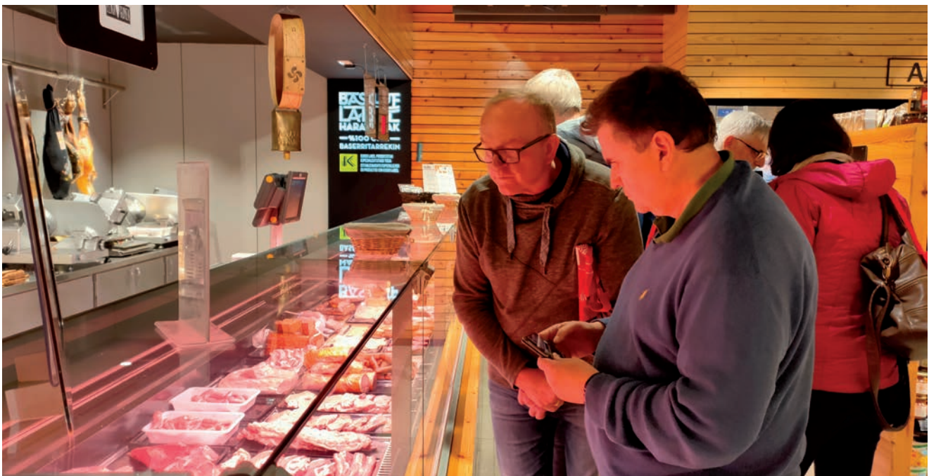
Basque Label harategien funtzionamenduaz gain, bertako haragiaren kalitatea arretaz aztertu zuten.