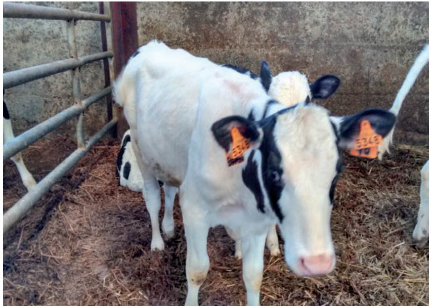
BOST URTEREN BURUAN KOMERTZIALIZATU NAHI DUTE

Proiektu hauek sektorean sortzen duten ezinegona handia da, izan ere, ekoizten dituzten produktuak ez baitira inondik inora benetako esnea. Atzean dagoen diskurtsoa ikerketa zientifikoaren kutsuz janzten den arren, ingurumena zaintzeko eta denen osasuna babesteko asmo filantropikoz ari direla azaltzen duten arren, errealitateak beste kolore bat duela argi dugu EHNETik.