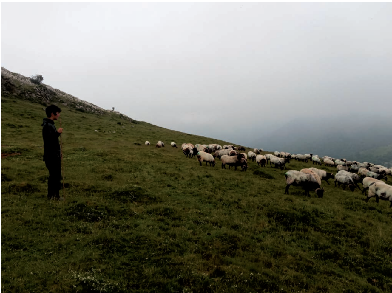
IRUDIAN, GALÁN, IPARRALDEAN ARTZAI LANETAN ARITU ZENEKOA.