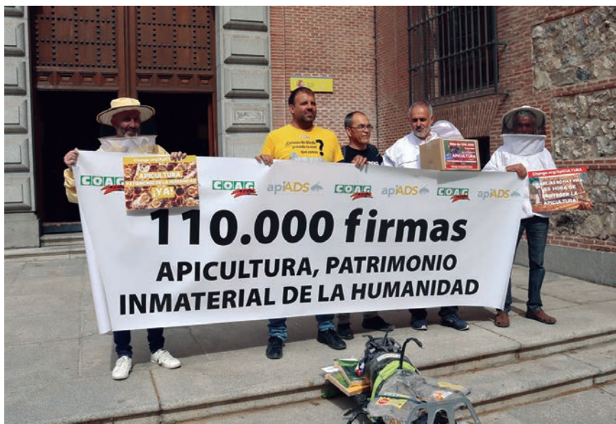
ACTO DE PRESENTACIÓN DE LA CAMPAÑA.