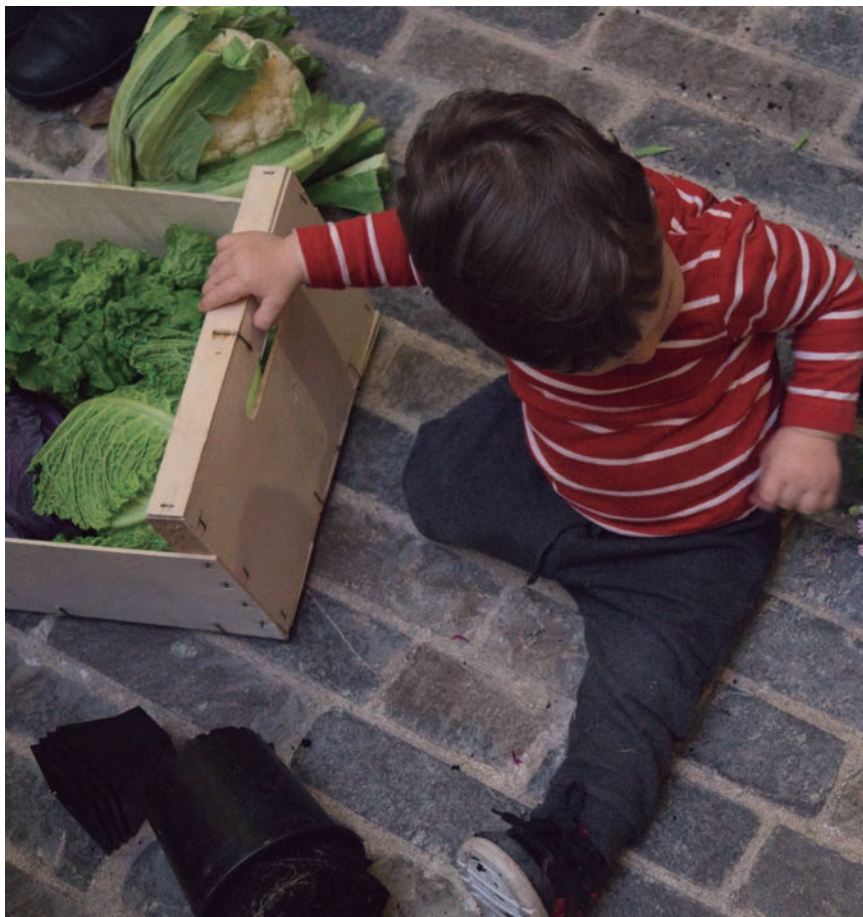
LA ACEPTACIÓN SOCIAL HACIA EL CONSUMO DE PRODUCTOS ECOLÓGICOS VA AL ALZA

bución y comercialización de productos ecológicos. De este modo, en marzo de 2019 se puso en marcha el Centro de Acopio, ubicado en Noain y gestionado por la asociación Ekoalde, formada por personas productoras y elaboradoras certificadas en ecológico en Navarra, que ofrecen una oferta combinada y estable de diversos productos, como hortalizas, frutas, lácteos, aceite, carne,