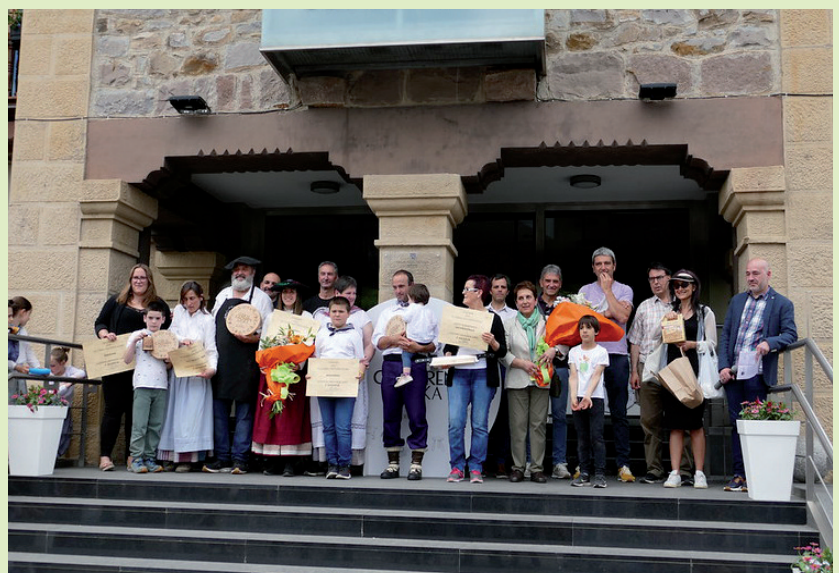
EUSKAL GAZTAREN IV. AZOKA, JENDETSUA. Bi urtez Euskal Gaztaren Azoka egin gabe egon ondoren, aurten berriz ere ekin diote festari. Maiatzaren lehen igandean egin zuten festa eta dastaketa herrikoian J. Aranburu, Gaztañaditxulo eta Bostibaiaeta Sc izan ziren lehen hiru sailkatuak.

Batzar Nagusietako alderdi politikoetako ordezkari guztiek Gipuzkoako lehen sektoreari eusteko konpromisoa agertu zuten eta lanketa horretan sakontzeko borondatea erakutsi.