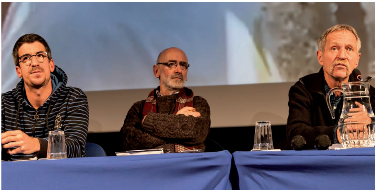
XOSE BOVÉREN TAFALLAKO HITZALDIAN ERE IZAN ZEN BERHOKOIRIGOIN IBERO NAFARROAKO EHNEKO PRESIDENTE OIHAREKIN BATERA