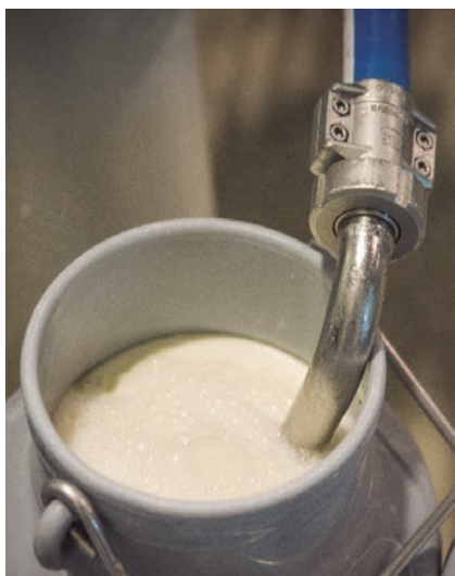
SE PODRÁ REVISAR ALGUNOS CONTRATOS.