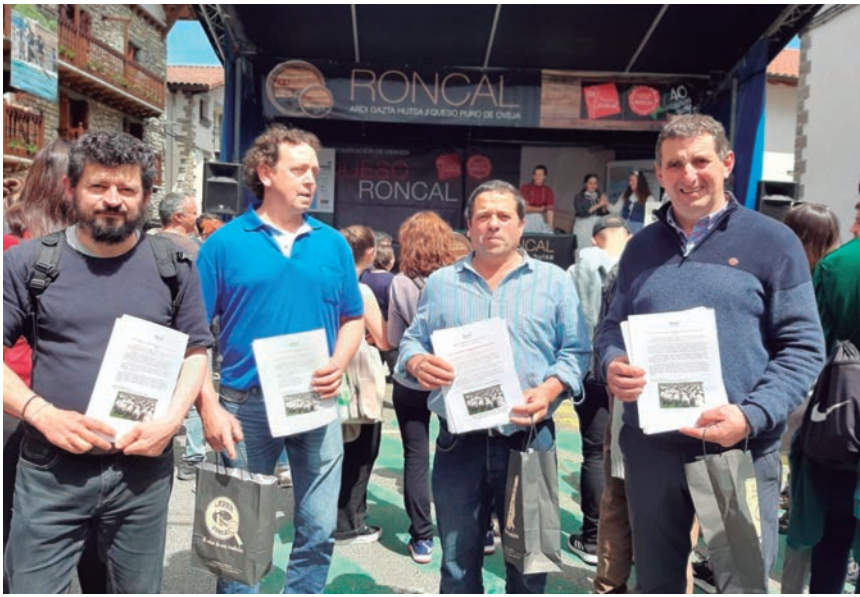
MIEMBROS DE LA D.O. RONCAL Y DE EHNE, REPARTIENDO FOLLETOS