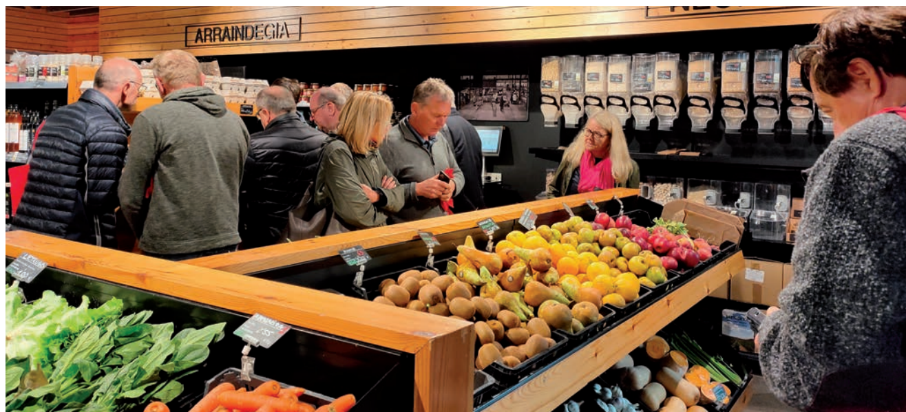
Azpeitiako Elikaguneak arreta eman zien Austriatik etorritako bisitariei.