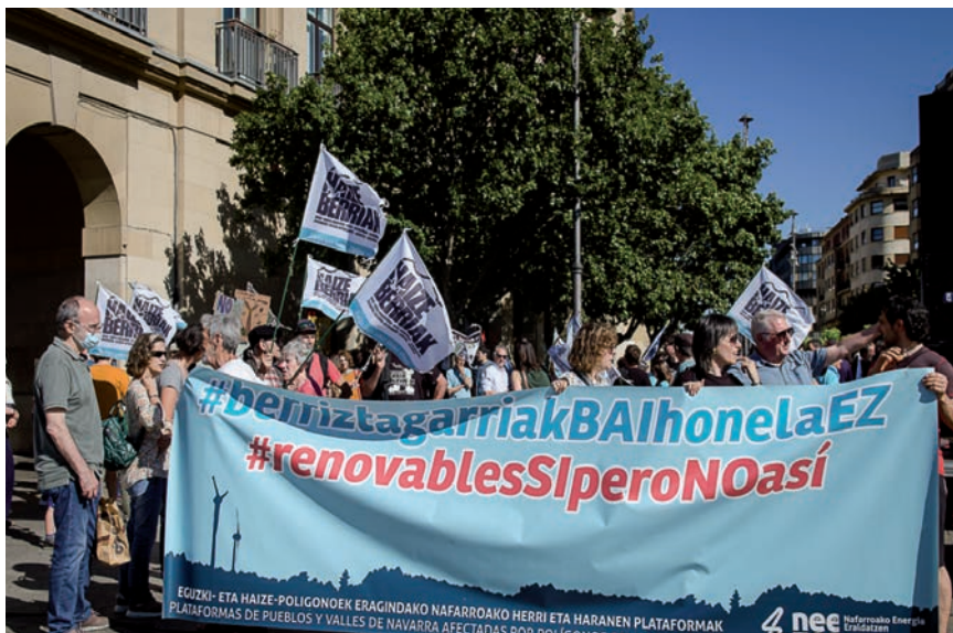
JENDETZA ELKARTU ZEN MANIFESTAZIOAN.