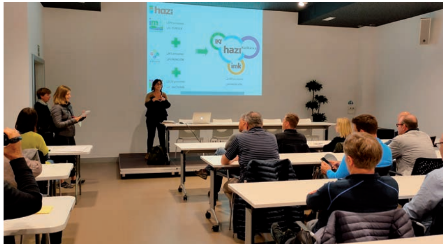
Haziko ordezkariak Label markari buruzko azalpenak eman zizkieten.

Biharamunean Lumagorri oilaskoak hazten dituen Mendiko baserrian izan ziren bertako maneia ezagutzen. Mahala baserriko abereen maneia eta bertako produktuen ekoizpenarekin interesa agertu zuten. Eta goiza bukatzeko, Hika Txakolindegian egon ziren. Txakolina asko estimatu zuten, baita haren ekoizpenari buruzko azalpena ere. BM supermerkatu batean ere izan ziren bertako haragiarekin darabilten politika ezagutzeko. Baserritarrei zor zaien garrantzia emateko ahalegina zoriondu zuten.