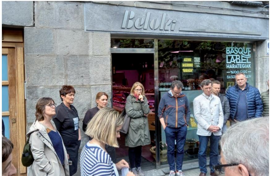
Azkoitiako Basque Labeleko Beloki harategian azalpenak entzun zituzten.