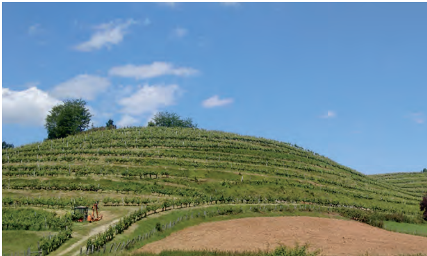
LURZAINDIA HA COMPRADO TERRENO RURAL EN DONIBANE LOHIZUNE