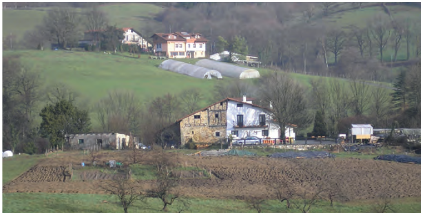
IMAGEN DE LOS TERRENOS AFECTADOS POR EL PROYECTO DEL TAV