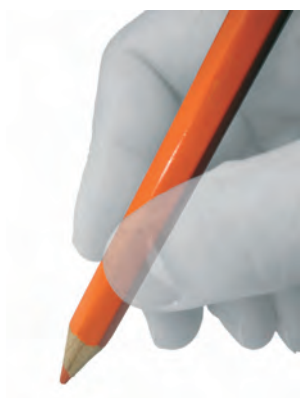
Iritzi artikulua Cartas de opinión