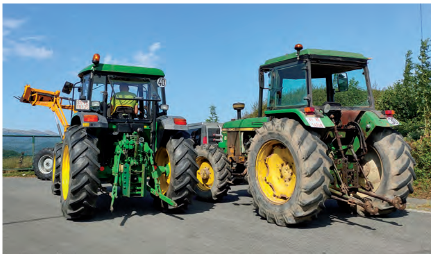
GAINONTZEKO ESKUALDEETAN DATA JARTZEKO EXIJITU ZAIO JAURLARITZARI

Pasa den urte bukaeraz geroztik Gipuzkoako EHNE presioa egiten ari da Tolosaldean, Goierri eta Beterrin traktoreek IATa (ITV) pasa dezaten herrietan. Eusko Jaurlaritzako Industria sailarekin martxoan elkar-tu ondoren, abuztuaren 7an IAT azterketa Idiazabalaren egitea lortu zen, baina arazoa ez dela hor bukatzen eta denbora pasa ahala egoera okertzen eta larriagotzen doala adierazi zaio Jaurlaritzako Industria Sailari. Beste data batzuk exijitu zaizkio Tolosaldeko eta Goierriko beste herri batzuetan IATa egiteko, baina abuztuan ez du erantzunik eman.