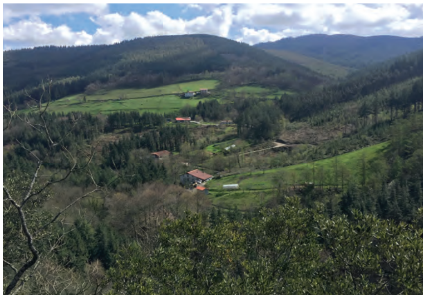
ATAUN HA PUBLICADO UNA ORDENANZA PARA REGULAR LOS AHUYENTADORES

Ataungo Udalak 'Nekazaritzako edo basogintzako lanetan soinugailuak erabiltzeagatik kutsadura akustikoa prebenitzeko ordenantza orokorra' araua jarri du indarrean. Aipatu arauak txorimalo akustiko automatikoen eta uxatzaile digitalen zarata arautzea du helburu, Udalaren esanetan, "leherketek landa eremuan dituzten ondorio kaltegarriak saihesteko, prebenitzeko eta murrizteko". Baso landaketetan, baratzeetan, nahiz larreetan basa animaliek eragiten dituzten kalteak saihesteko hainbat baserritarrek txorimalo akustiko automatikoak eta uxatzaile digitalak erabiltzen hasi dira. Gailuek zarata ateratzen dutela kexu agertu dira hainbat herritar eta horri erantzunez jorratu du araua Udalak.