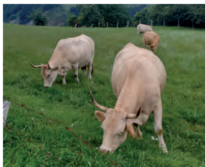
VACUNO DE CARNE

Gipuzkoako EHNEtik garbi adierazi nahi genien ez genuela bertan erabaki bat hartuko, ikusirik aurrez nola erabili den parte-hartzaileon izena guk erabaki ez ditugun gauzak martxan jartzeko, eta barne mailan hitz egin ondoren iritzia helaraziko geniola esan zitzaien. Honetarako ordea, ezinbestekotzat jotzen genuela helarazi zitzaien “IBR programa” esaten dugunaren definizioa (zer eragin izango duen baserritarren egunerokoan) eta kostu ekonomikoak argitzea, bai baserritarrenak eta bai Aldundiarenak (kontuan izan