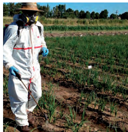
EMAN IZENA IKASTAROAN