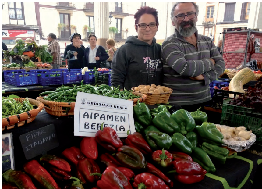
ORDIZIAKO EUSKAL JAIEN AZOKA BEREZIKO IRUDIA. GOIERRIKO HITZA

Lehiaketa eta txapelketen egutegia hankaz gora gelditu da aurtien Euskal Herrian, izan ere, azken unera arte ez baitira zehaztu egingo diren ala ez. Esaterako, Uharte Arakilgo Artzai Gazta txapelketa bertan behera gelditu da, baita Elizondoko behi piri-