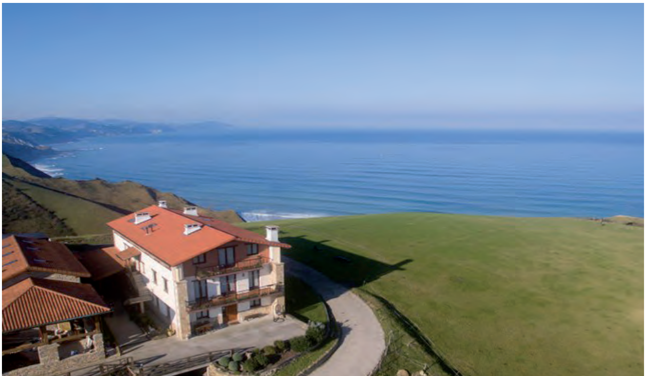
AGROTURISMO SANTA KLARA DE ZUMAIA