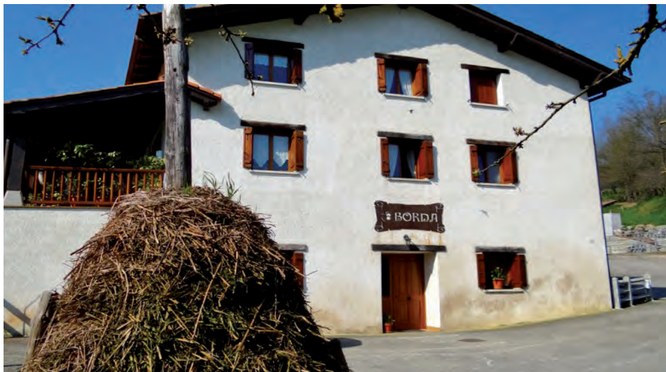
AGROTURISMO BORDA DE OLABERRIA