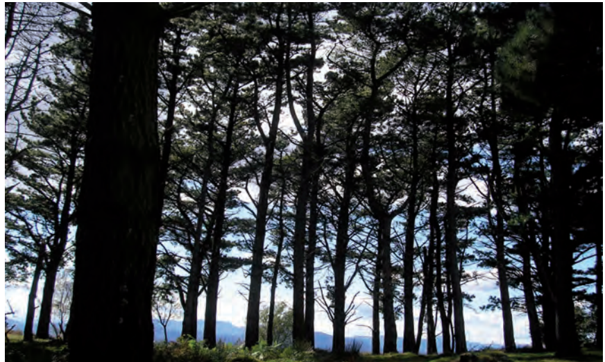
XINGOLA MARROIAREN KONTRAKO TRATAMENTUA EMATEKO AGINDU FORALA ATERA DUTE

A continuación se citan los productos fitosanitarios y las condiciones de uso de los mismos: