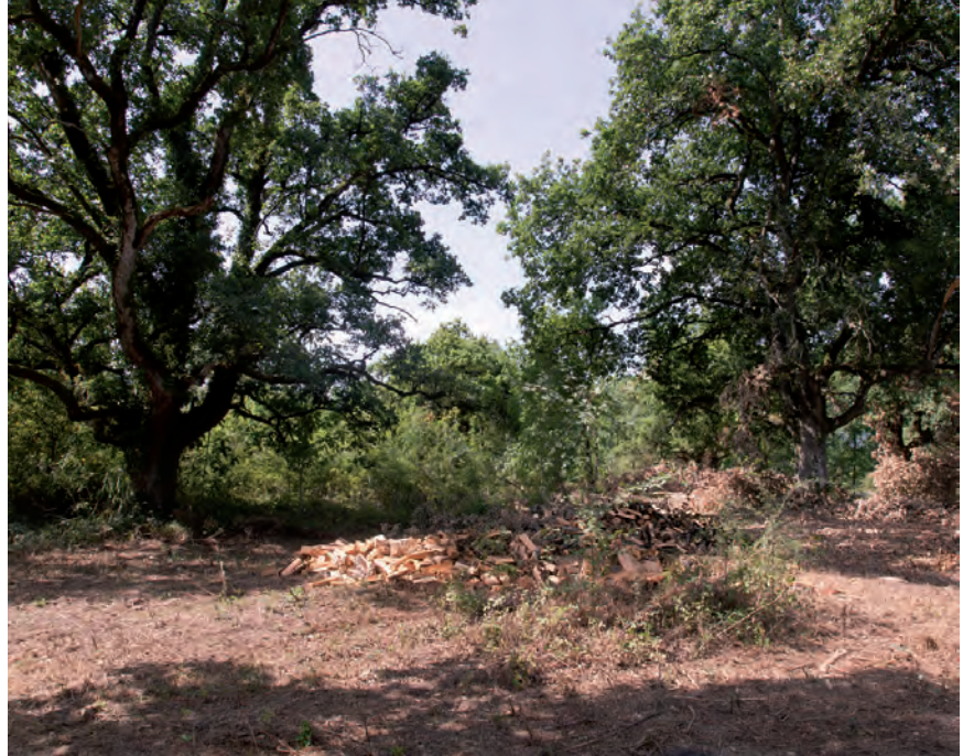
LA DEHESA DE BASOZELAI SE ENCUENTRA EN SU PRIMERA FASE DE RECUPERACIÓN.

Dicho y hecho, este último proyecto que se está aplicando en Basozelai se inició en la pasada legislatura y se le ha dado continuidad en la presente. De momento, esta primera etapa de clareado de la zona -se dejan exclusivamente los árboles más grandes y centenarios- solo ha permitido la entrada de ganado caballar (pottokas), pero está previsto el ovino y también otros de índole mayor. “La realidad es que en esta primera fase es necesaria una mayor carga gana-