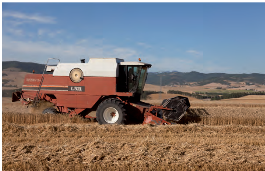
LA COSECHA DE CEREAL 2020 HA SIDO POSITIVA EN TÉRMINOS GENERALES

En algunas variantes, como el caso de la colza, las buenas condiciones climáticas otoñales supusieron una magnífica siembra, lo que, a la postre, resultó un inconveniente, por el exceso de planta por hectárea, evaluado por Garlan en un 30%, si bien el rendimiento final acabó siendo homogéneo en todas las comarcas del herrialde.