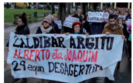
MARKINAN EGINDAKO MANIFESTAZIOA

Ekainean Verter Recyclingeko bi goi kargudun atxilotu zituen Ertzaintzak eta biharamunean epailearen aurretik igaro ziren. Ondoren, behin-behinean aske geratu ziren kautelazko neurriekin: hilean behin epaitegira joan behar dute eta pasaportea kendu diete.